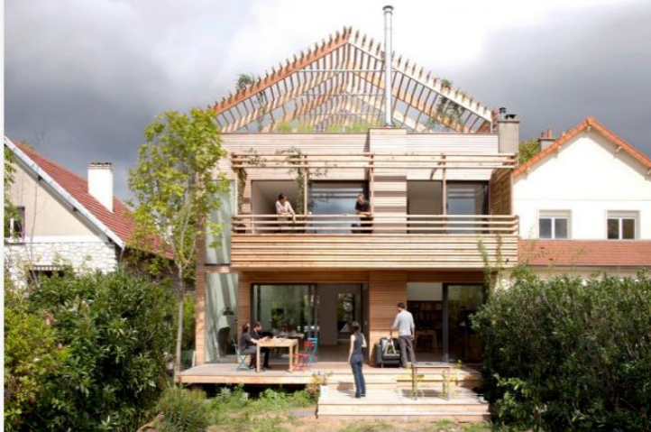
Maison éco-durable à Antony par Djuric Tardio Architectes